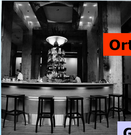
Orte für Gesundheitsförderung