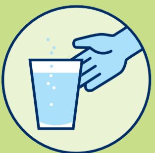
تذكير بشرب السوائل

قدم كميات وفيرة من الماء، العصائر المخففة، أو الشاي غير المحلى