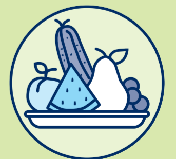
تناول طعام خفيف

كن يقظًا، وفي الحالات الطارئة اتصل بالإسعاف فورًا