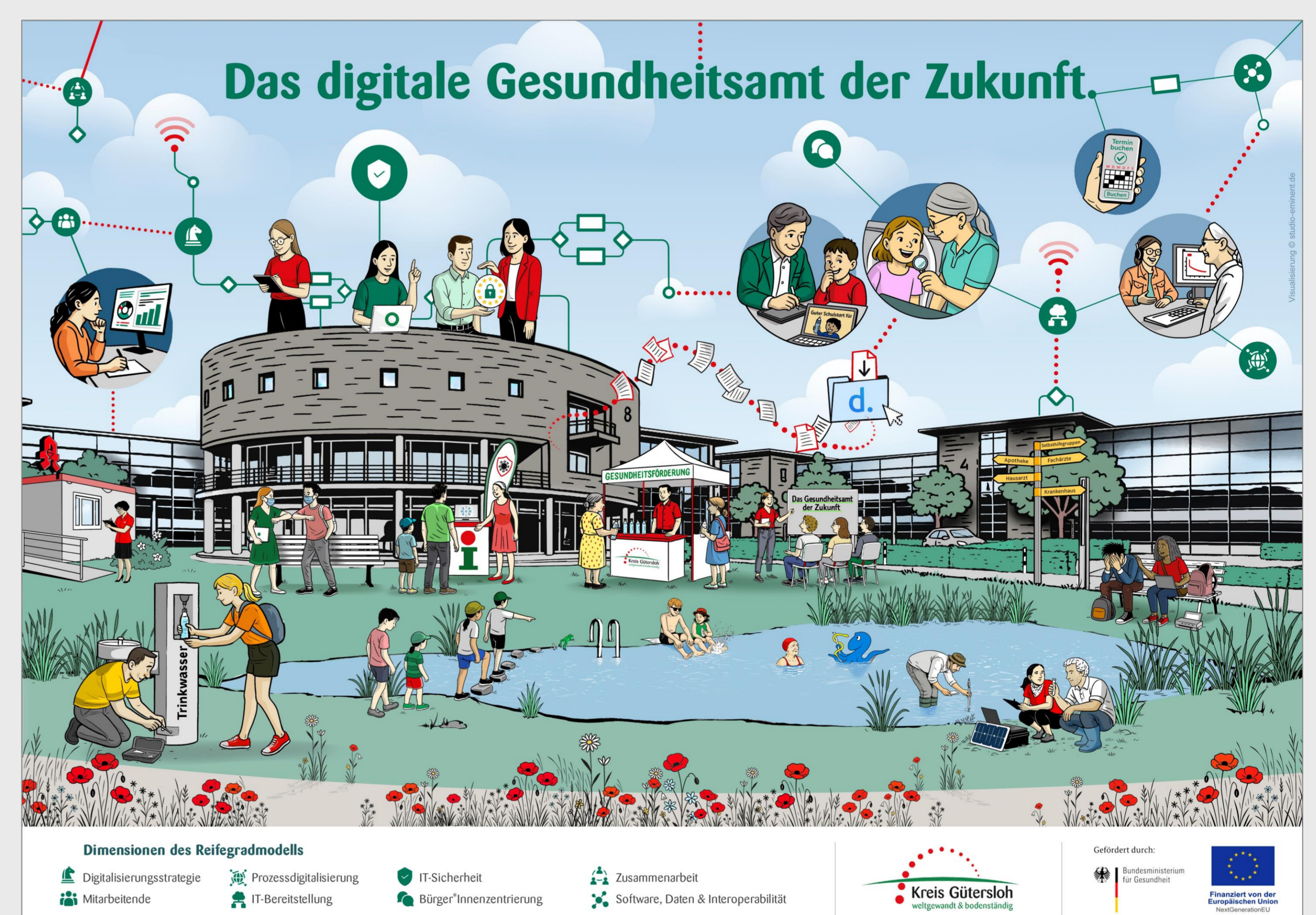
Abbildung 2: Das digitale Gesundheitsamt Gütersloh, Quelle: Eigene Datei, erstellt von Studio Eminent.