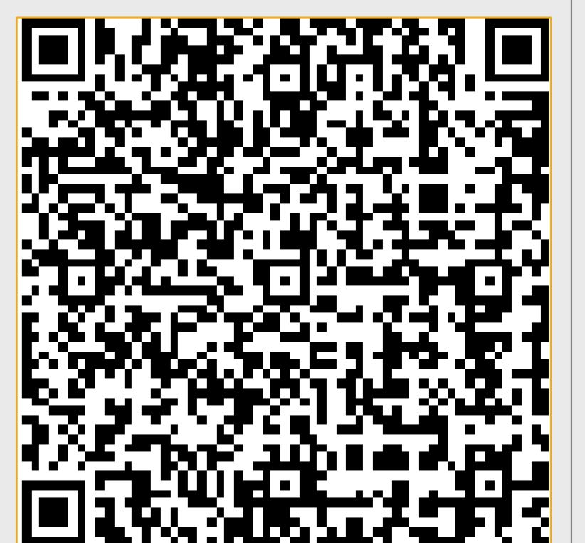
Abb. 5 QR-Code zum Öffnen der Seite der Schuleingangsuntersuchung auf dem Gesundheitsportal Lippe