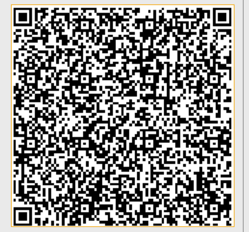
Abb. 6 QR-Code zum Öffnen des Online-Formulars im Serviceportal zur Anzeige nach § 11 Abs. 1 TrinkwV