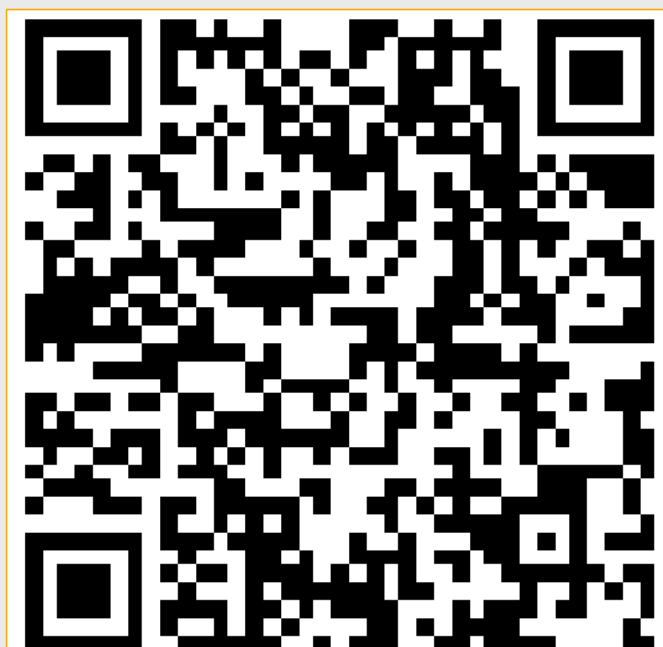
Abb. 2 QR-Code zum Öffnen des Gesundheitsportal Lippe

Einrichtung eines umfassenden Internetauftrittes des Gesundheitsamtes Kreis Lippe mit der Vorstellung der Aufgaben des Gesundheitsamtes. Zudem sind Informationen zu verschiedenen Themen der körperlichen und seelischen Gesundheit im Gesundheitsportal-Lippe eingebettet.