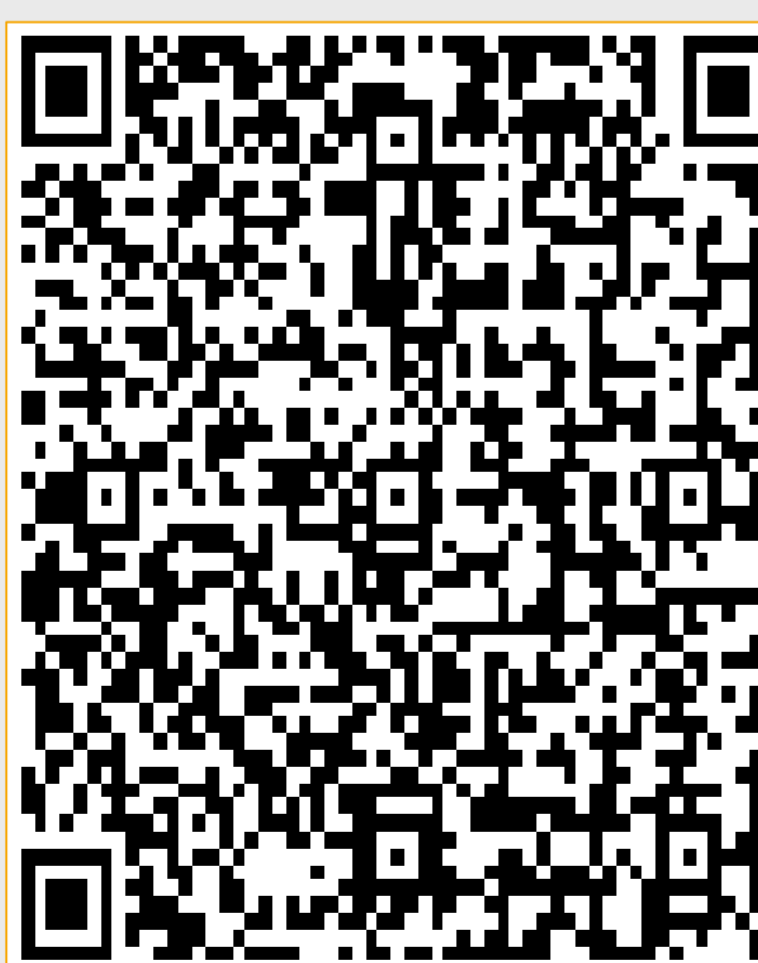
Abb. 3 QR-Code zum Öffnen der Seite „Jhr gesunder Alltag – Familie Lippig wird gesund“ auf dem Gesundheitsportal Lippe