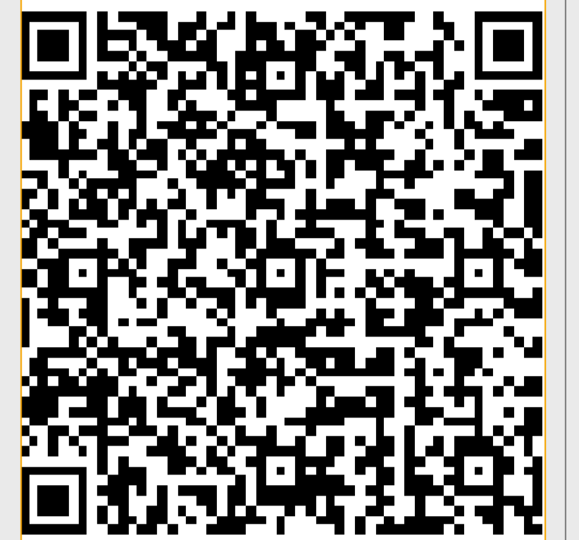
Abb. 4 QR-Code zum Öffnen der Seite des Amtsärztlichen Dienstes auf dem Gesundheitsportal Lippe